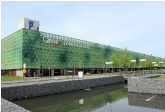
Q-Park parkeergarage Krimpenerstraat

De maximale doorrijhoogte is 2.10 m, maar u kunt ook parkeren op de buitenparkeerplaats in de Stolwijkstraat.