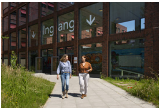
Ingang achterzijde ziekenhuis

Er is een ingang aan de achterzijde van het ziekenhuis. Deze bevindt zich schuin tegenover de parkeergarage. De ingang aan de achterzijde is geopend van 07.00 - 20.00 uur.