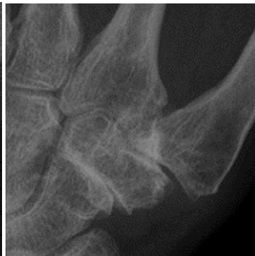
Röntgenfoto waarbij beginnende slijtage en een verzakking van het CMC1 gewricht en slijtgage van het STT gewricht is te zien